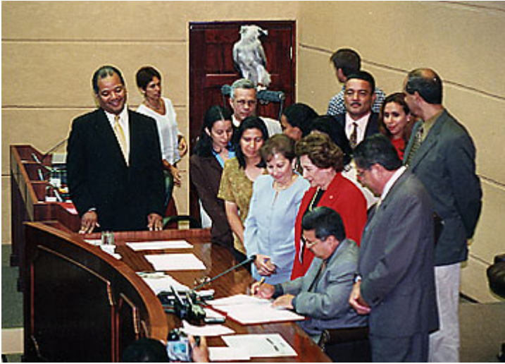
Asamblea Legislativa de Panama