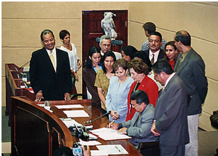
Asamblea Legislativa de Panama